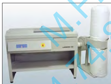
Système d'aspiration des déchets et des vapeurs de colle