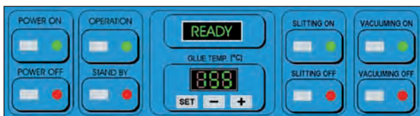
Panneau de commande électronique