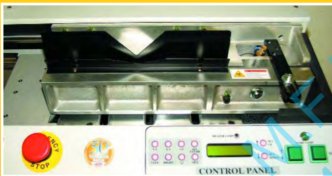
Tableau de commandes.