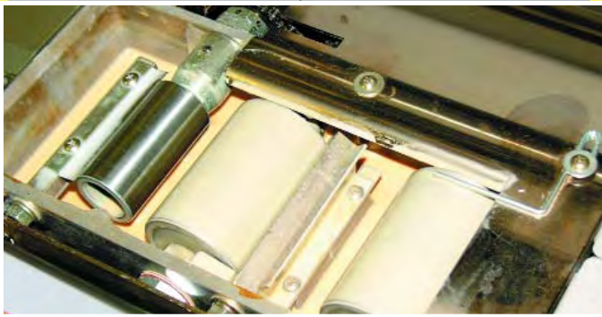
Double cylindre d'encollage.