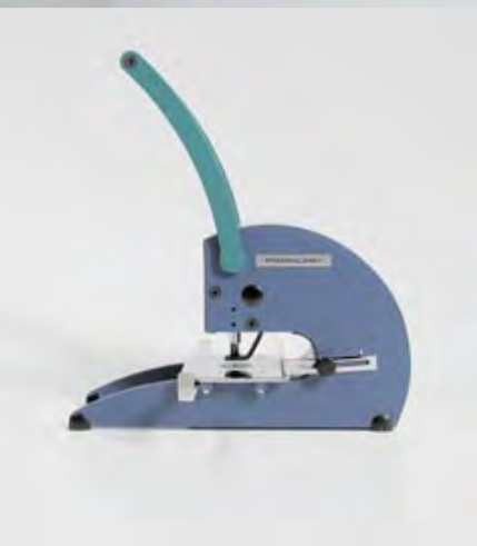
PERNUMA PERFOSET I/L, II/L et II/LA Machines manuelles à poinçon