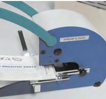
PERFOSET I/L, II/L et II/LA Machines manuelles à poinçon