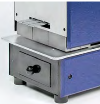
OFFICE D Perforeuse dateuse électrique