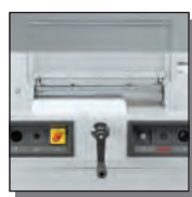
Carter de protection avant