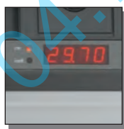
Affichage digital des dimensions

Ce massicot électrique dispose d'une tenue professionnelle et de nombreux équipements à vous couper le souffle.