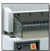
Carters de protection avant et arrière