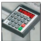
Commande électronique programmable EP