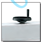
Dispositif de pression par volant