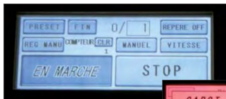
Large écran LCD tactile, en couleur et en français pour une utilisation simple et conviviale