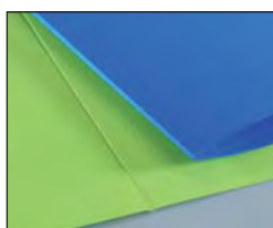
Rainage par marteau et enclume