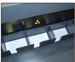
Plateau de réception des cartes de visite