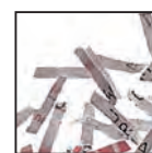
Coupe croisée 2 x 15 mm Niveau de sécurité DIN 4 Documents confidentiels ou secrets.