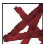
Coupe croisée 4 x 40 mm Niveau de sécurité DIN 3 Documents confidentiels.