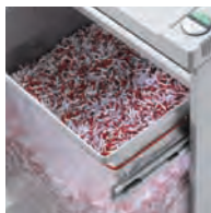
Cadre porte-sac sur glissières télescopiques