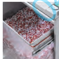
Cadre porte-sac sur glissières télescopiques