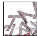
Coupe croisée 2 x 15 mm Niveau de sécurité DIN 4 Documents confidentiels ou secrets.