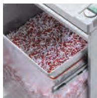
Cadre porte-sac sur glissières télescopiques