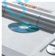
Destruction de cédéroms