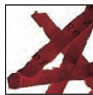
Coupe croisée 4 x 40 mm Niveau de sécurité DIN 3 Documents confidentiels.