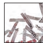
Coupe croisée 2 x 15 mm Niveau de sécurité DIN 4 Documents confidentiels ou secrets.