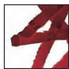
Coupe croisée 4 x 40 mm Niveau de sécurité DIN 3 Documents confidentiels.