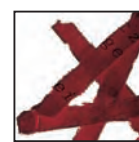
Coupe croisée 4 x 40 mm Niveau de sécurité DIN 3 Documents confidentiels.