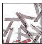
Coupe croisée 2 x 15 mm Niveau de sécurité DIN 4 Documents confidentiels ou secrets.