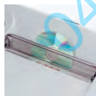
Destruction de cédéroms